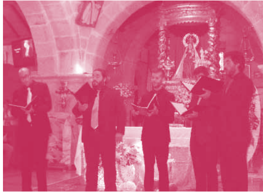
IV Certame de Música Antiga. 15 de agosto 2012

Visita al Monasterio de Piedra, Zaragoza, Torreciudad, y al regreso Burgos , Astorga y La Bañeza.