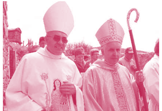
Romería das Pascuillas 2012